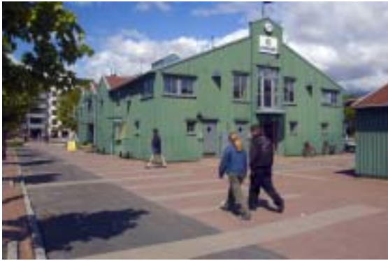
Mölnlyckes nya kommunikationscentrum

projekt som skaprioriteras. I korthet kommer projekt som stärker den regionala utvecklingen att prioriteras. Det handlar om ett förbättrat kollektivtrafiksystem, utbyggda ringleder, särskilda miljöskyddsåtgärder och utbyggnad av den regionala tågtrafiken. Ett bra exempel på ett projekt som inneburit en rejäl injektion i området är upprustningen av Mölnlycke centrum. Liknande resultat kan ses kring satsningarna i Alingsås och Kungsbacka.