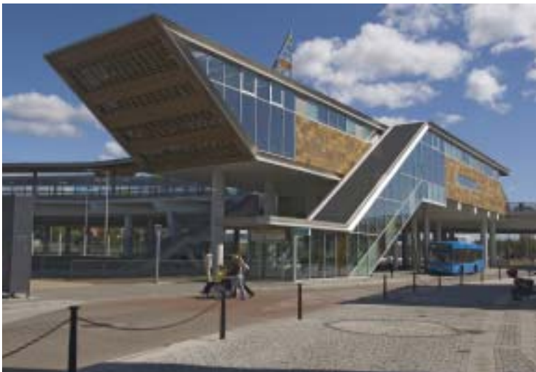
Mölnalvsbron har byggts med plats för bussar och bilar vid nedgången till pendeltågsstationen.

Götatunneln är det största vägprojektet i Göteborgsöverenskommelsen. Tunneln omfattar en sträcka på 3 km och kostar ca 3 miljarder kronor. Det är ett gigantiskt och komplicerat projekt utmed hela Göteborgs innerstad. Med Götatunneln öppnas södra älvstranden, och staden återfår