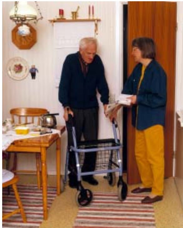
Satsningar görs för att höja kompetens för personal inom äldreomsorgen.

Sedan 1997 har arbetsmarknaden förbättrats både i Göteborgsregionen och i landet i övrigt. Men utvecklingen är inte entydig eftersom sjukskrivningarna samtidigt har ökat. Den minskade arbetslösheten har