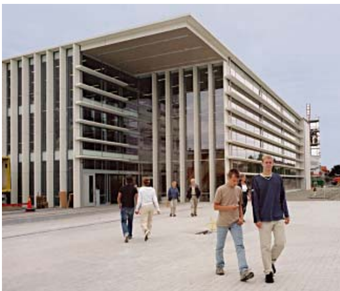
Mimers hus i Kungälv. Nybyggd gymnasieskola och kulturhus med bibliotek och teater.

Flera förortskommuner planerade på 80-talet att på kort tid bygga egna gymnasieskolor. Med hänsyn till den befarade risken att stå med tomma lokaler och övertalighet i lärarkåren kom man inom GR överens om en utbyggnadsordning. Utöver Göteborgs, Mölndals och Kungälv's gymnasieskolor byggdes i tur och ordning skolor i Kungsbacka, Partille, Stenungsund och Lerum. Därefter byggdes gymnasieskolor i Ale och Härryda som togs i bruk 1995.