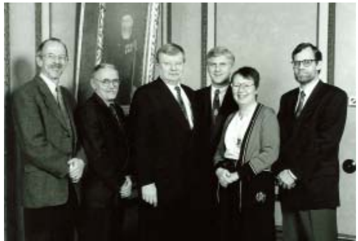
Nya GRs första presidie och förbundsledning

Inriktningen i GRs verksamhet arbetas fram av sex politiska styrgrupper: Rådet för regional utveckling, Utbildningsgruppen samt styrgrupperna för Regional planering, Arbetsmarknad,