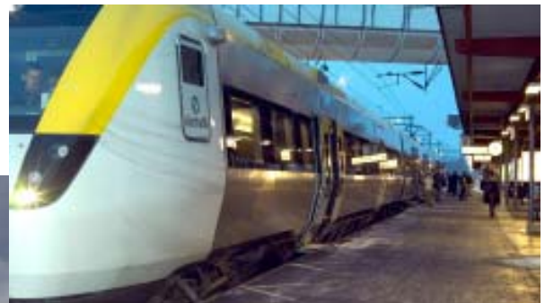
Nils Ericssonplatsen, regionalt kommunikationscentrum vid Göteborgs central